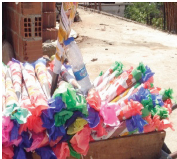
Recife, 2009. Foto de Rosi Silva