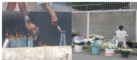
Figura 6: Velário do Morro da Conceição. Vendedora de flores. Recife, 2009.

No imaginário popular a promessa de acender velas e apresentar o divino com flores são práticas simbólicas, e foram resignificadas no decorrer da festa. No decorrer da visita ao Santuário, os assistentes aspergiam água benta nas flores e velas e devolviam aos fiéis. Em festas anteriores, os elementos folk faziam parte do cenário da festa (Figura 6).