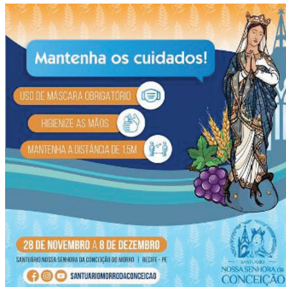
Figura 5: Cartaz publicado na 116ª festa de Nossa Senhora da Conceição. Recife, 2020.