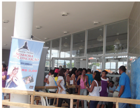
Figura 3: Estúdio montado próximo a igreja para a produção de foto lembrança. Recife, 2009.

Nesse cenário da globalização, foi possível encontrar uma dinâmica de produção de fotos utilizando os recursos da tecnologia digital, para comercialização da imagem como uma lembrança da festa.