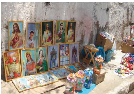
Figura 7: Venda de Produtos no percurso das ladeiras do Morro da Conceição. Recife, 2009.

No decorrer do percurso das ladeiras, até chegar ao santuário, não foi permitida a venda de produtos, como velas, flores e doces tradicionais da festa, assim como foram também suspensos os serviços de venda de alimentos e bebidas que em festas anteriores foram comercializados pelos bares e residências que se localizam no percurso da caminhada até o santuário. A imagem (Figura 7) da festa em anos anteriores retrata as mercadorias expostas à venda, na ladeira do percurso até a chegada ao Santuário.