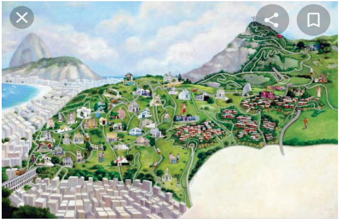
Ilustração: Ana Maria Moura

Sarlo (2008), no mesmo caminho, em trabalho sobre a vivência urbana em grandes cidades, aposta exatamente na ideia do labirinto como uma possibilidade de ocultação e redescoberta de um habitar na cidade. Assim, entende que o mesmo estimule o vivido e a experiência urbana sentida de perto. Também sob a metáfora do labirinto, Jacques (2011) comenta a respeito das favelas da cidade, localizadas constantemente em seus maciços rochosos, que hibridizam relações entre a vida urbana caótica e o olhar contemplativo de viver a cidade acima de seu conhecido mar.