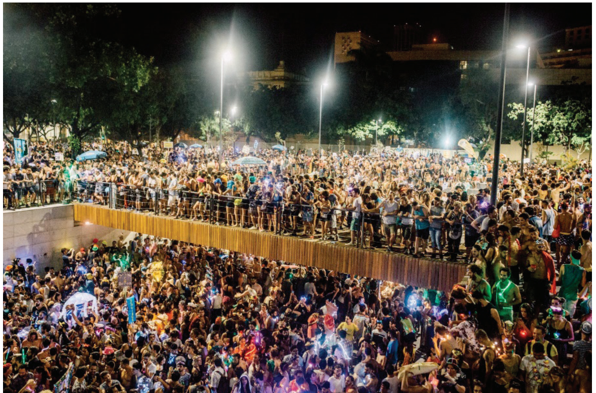
Figura 1: Minha Luz é de Led.