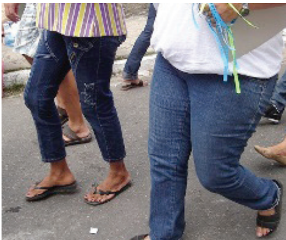
Figura 2: Fiéis descendo as ladeiras com as fitas de Nossa Senhora. Recife, 2009

A prática folkcomunicação de oferecer objetos para alcançar uma graça é uma manifestação de fé e agradecimento ao Divino, e essa linguagem de comunicação é retratada por Beltrão (2004, p.118) quando cita o uso de outros elementos Folk como quadros, imagens, fotografias, desenhos, peças de roupa, utensílios domésticos, dentre outros.